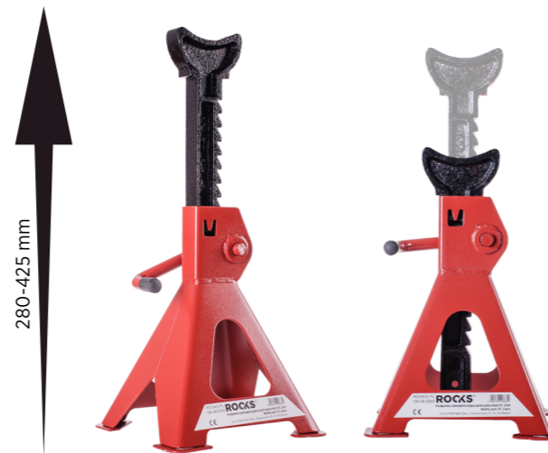
OK-08.0030 Podpórka zabezpieczająca pod samochód 3 t, 2 szt. cena brutto: 99,00 zł