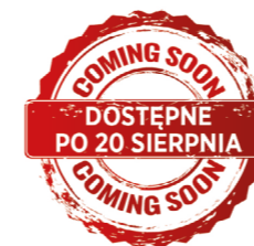
OK-08.0100 Podnośnik skrzyni biegów 500 kg, STRONG cena brutto: 600,00 zł