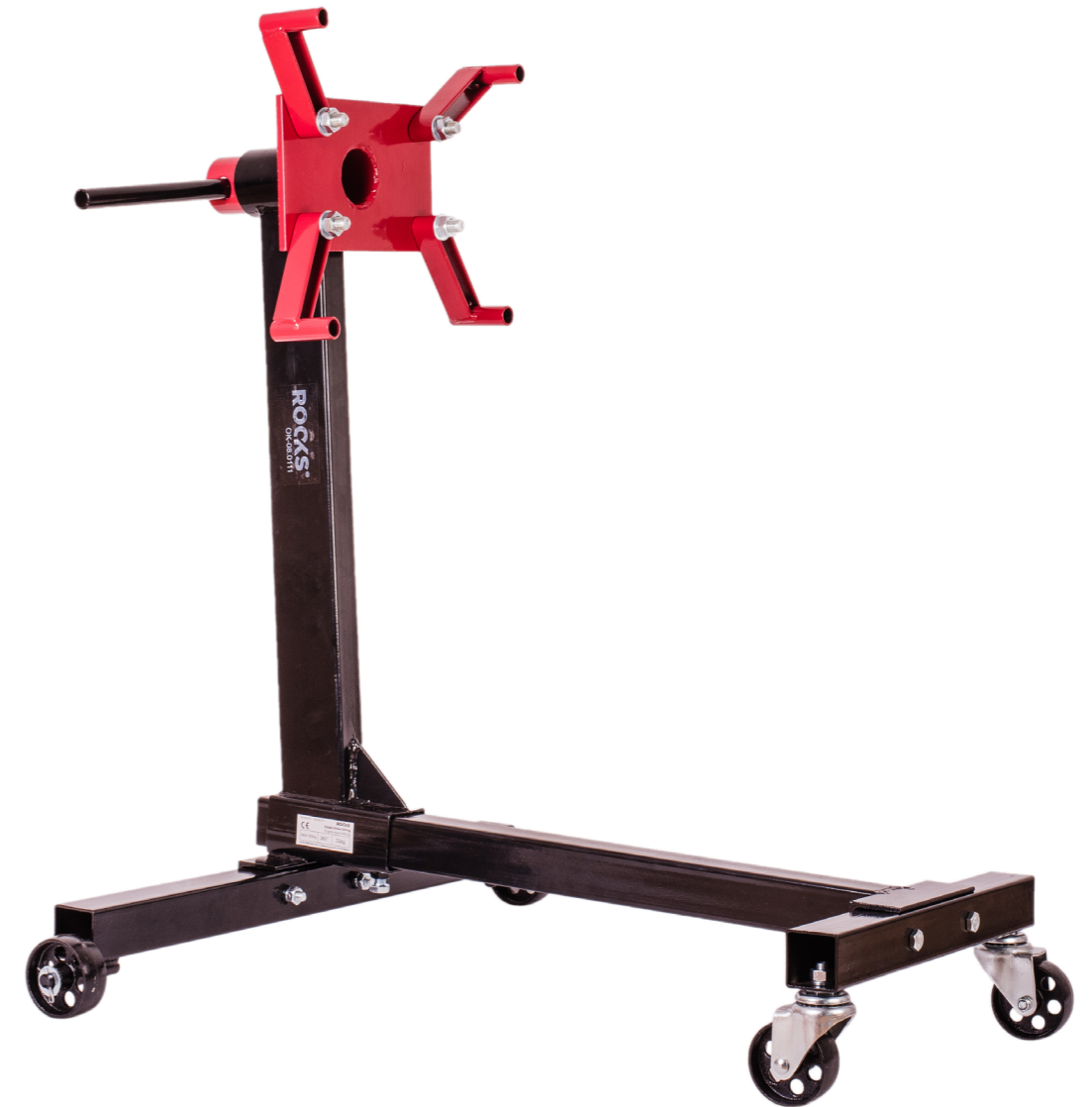
OK-08.0111 Stojak silnika 500 kg cena brutto: 230,00 zł