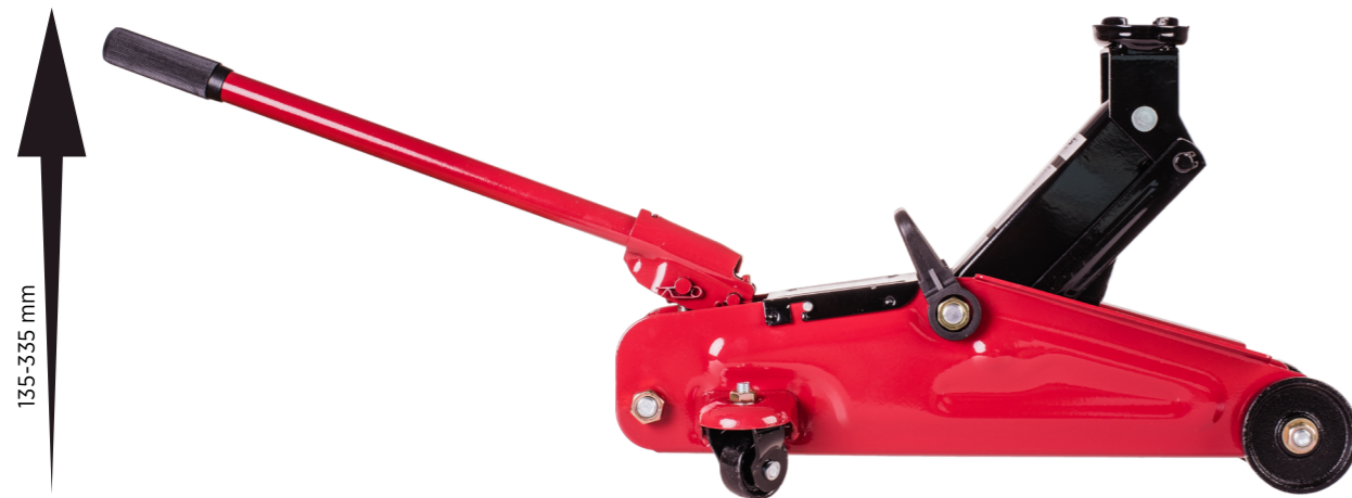
OK-08.0001 Podnośnik samochodowy BASIC, 2 t, żaba cena brutto: 130,00 zł