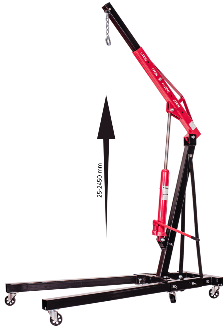
OK-08.0110 Żuraw warsztatowy do silnika 2 t cena brutto: 760,00 zł