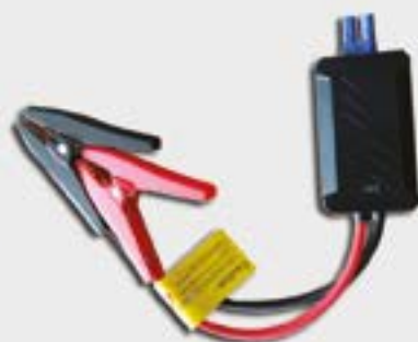
OK-03.0015 PRZEWODY ROZRUCHOWE INTELIGENT