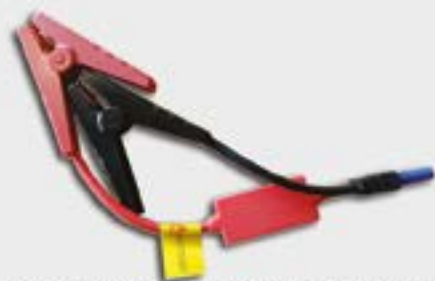
OK-03.0014 PRZEWODY ROZRUCHOWE STANDARD